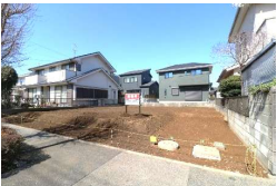
水道・下水・都市ガス 引込済み